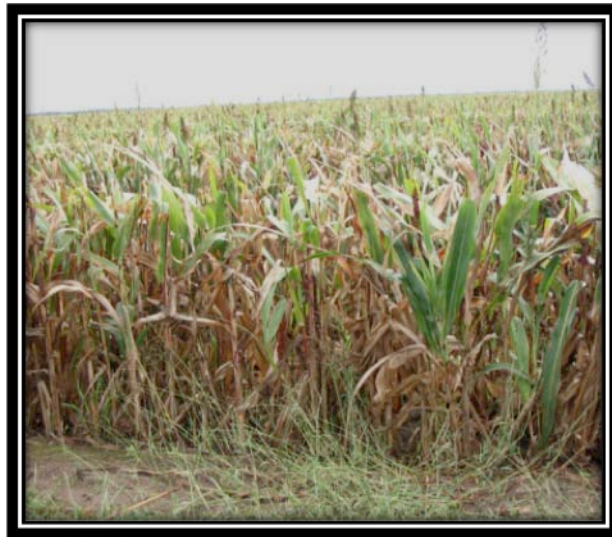
Figura 2. (A) Sorgho forrajero ([ Sorghum bicolor (L.) Moench.] (B) Sudax ( Sorghum bicolor x S. bicolor var. sudanense) y (C) vista del predio precosecha.