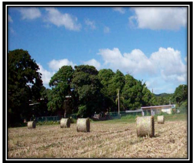
Material vegetativo en pacas cilíndricas