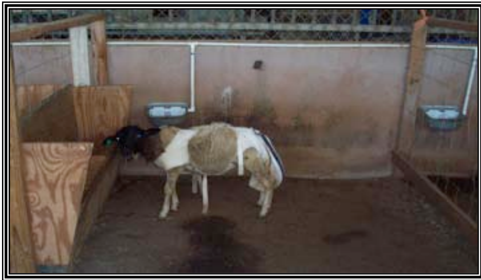
Figura 6. Ovino en su corral durante el periodo de recolección de heces fecales.