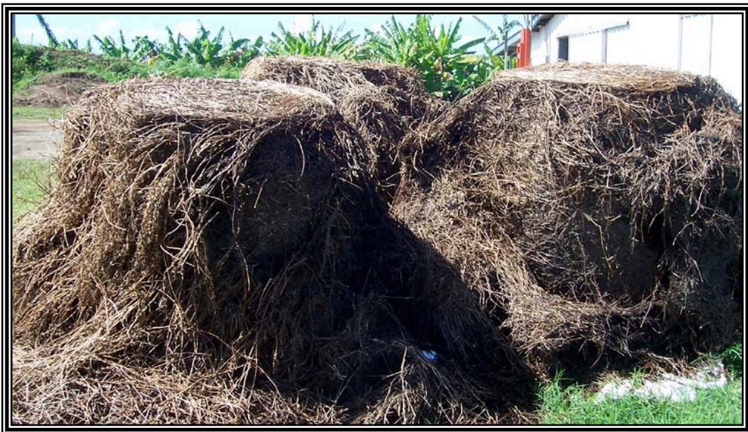
Figura 5. Sorgo forrajero y Sudax ofrecidos a los ovinos en la fase de alimentación.

partícula de aproximadamente 10 cm para facilitar el consumo. Los ovinos fueron distribuidos aleatoriamente entre 8 corrales individuales, con medidas de 1.11 x 0.74m ubicados en línea, y dos tratamientos dietéticos (Figura 5). Se pesaron los animales antes del período de adaptación a la dieta y al empezar la recolección de datos para ofrecer el henilaje diariamente a razón de 3% PV a base seca. Había agua disponible ad libitum en bebederos galvanizados automáticos. Todo el henilaje ofrecido había tenido un periodo de fermentación mínimo de 30 d y máximo de 45 d.