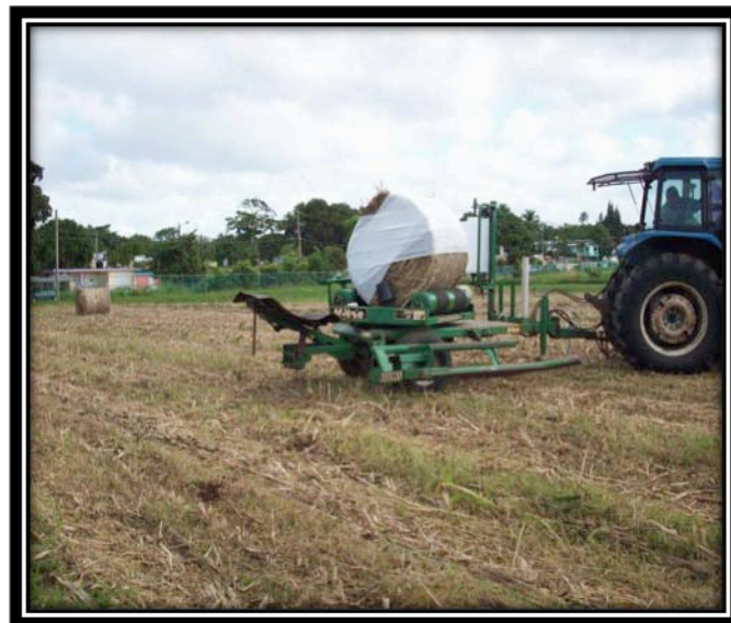
Maquinaria especializada que envuelve las pacas cilíndricas en polietileno