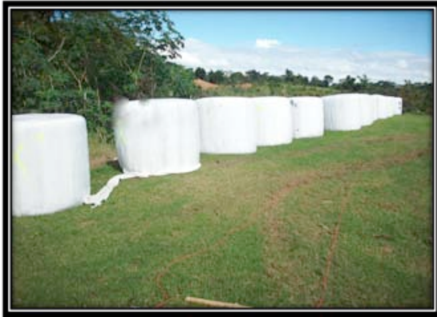
Figura 4. Pacas Cilíndricas de henilaje de sorgo forrajero y Sudax