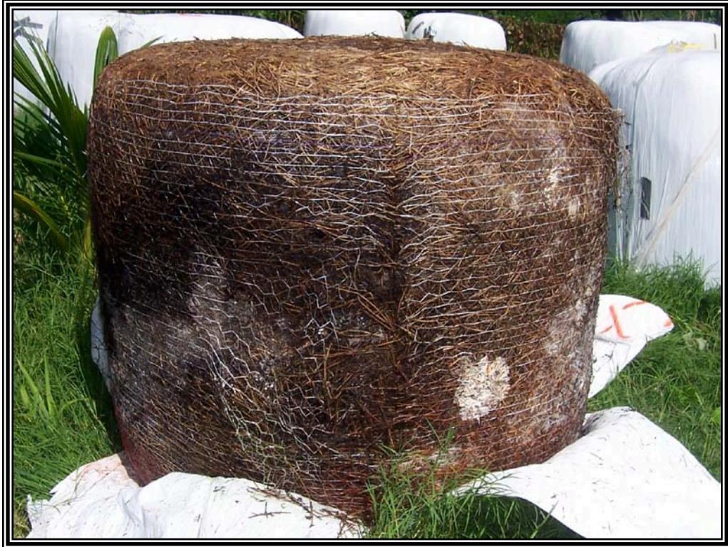
Figura 7. Paca cilíndrica de sorgo con el forraje fermentado.