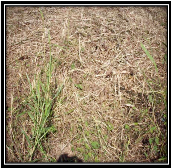
Proceso de marchitamiento después del corte (48 horas)